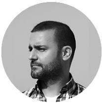
ANDRÉS HERNÁNDEZ DISEÑO GRÁFICO