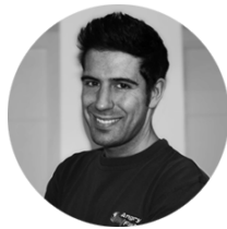
JESÚS PALACIOS DISEÑO GRÁFICO | UI