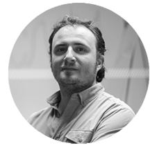
JAVIER BOHÓRQUEZ DISEÑO GRÁFICO